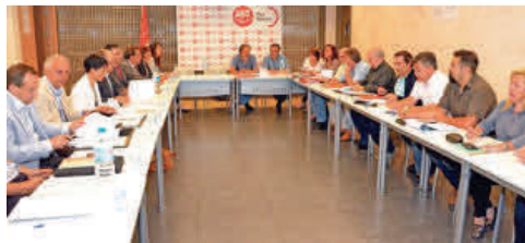
Imagen de una de las reuniones celebradas para la negociación del convenio de hostelería.

Los acuerdos finales alcanzados en los temas de incremento salarial y de vigencia del Convenio son las cuestiones que han provocado la postura de nuestra Patronal respecto a no rubricar dicho Convenio. Ello no evita la aplicación del mismo.