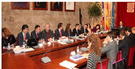
Imagen de archivo de una reunión del Govern Balear

Desde esta Asociación se consiguió que el mismo viernes en el que asistíamos a la aprobación de dichos impuestos, se firmase conjuntamente por 15 Patronales un comunicado de prensa en el que rechazábamos dichos acuerdos y anunciábamos iniciar los procesos que derecho procedieran.