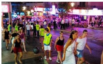
Repartidores de publicidad en la zona de Magalluf, Calvia.

De dichas cuestiones se remitirá a los empresarios de nuestro Sector que estén afectados la información para tramitar las solicitudes.