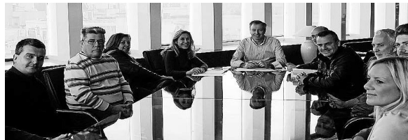
Imagen del Presidente del Consell con los Empresarios del Sector.

voluntad política firme por lo que, en algún momento y con el acuerdo del empresariado que representamos, se deberá tomar alguna decisión que haga prevalecer el máximo cumplimiento de la normativa en vigor sobre la ilegalidad absoluta de muchos establecimientos.