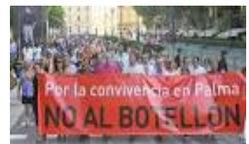
Manifestaciones contra el "Botellon"

Se insistió en la necesidad de planificar actuaciones contundentes respecto a este fenómeno y la constatación de que existe una voluntad política para terminar con esos comportamientos. Como consecuencia de ello tal y como se prevé en el artículo 11.1 de la Ordenanza, se ha solicitado por parte de todas las patronales con representación en la Playa de Palma, que se elabore el correspondiente informe preceptivo por la Policía Local con el objetivo de delimitar esta zona como de Especial intervención. Esta Asociación considera que esta es la única vía que permitirá actuar de forma contundente.