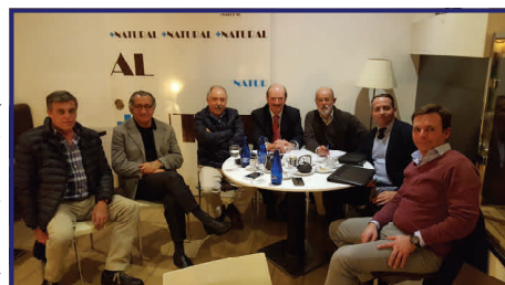
Reunión de Presidentes de Patronales Turísticas