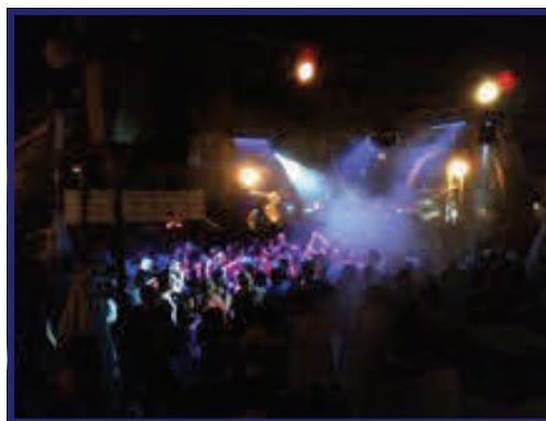
Imagen tomada de la fiesta.

Ello y ante la proliferación de distintos eventos a lo largo del verano en este mismo lugar (Village Copa del Rey, Día del orgullo Gay, Fiesta Flower Power, etc.), se ha solicitado una reunión urgente con el Alcalde de Palma para que reconduzca esta situación y consensue con nuestro Sector las actividades que en los espacios públicos nos hacen competencia.