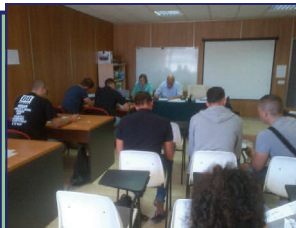
CELEBRADA EL 29 DE ABRIL 2014

Enviadas las correspondientes convocatorias a los Empresarios del Municipio de Sant Antonio de Portmany, donde tenemos establecido con el Ayuntamiento unos acuerdos respecto a las vallas publicitarias.